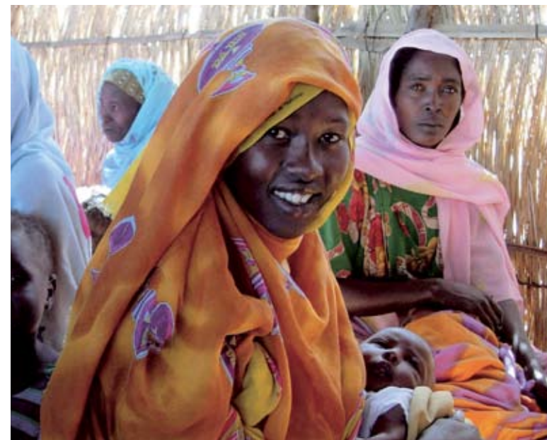
Mediante su colaboración con AmeriCares, Baxter ayuda a distribuir productos médicos esenciales a personas de todo el mundo. En África, las donaciones realizadas al campamento de Oure Cassoni en Chad han ayudado a los refugiados de la región sudanesa de Darfur.

Baxter y sus empleados forman parte de grandes y pequeñas comunidades en todo el mundo. Baxter ayuda a estas comunidades a enfrentarse a las necesidades más urgentes mediante donaciones de productos, contribuciones económicas, trabajo voluntario de sus empleados así como otras iniciativas y actividades. Estas inversiones refuerzan el objetivo fundamental de la compañía de salvar y mejorar vidas.